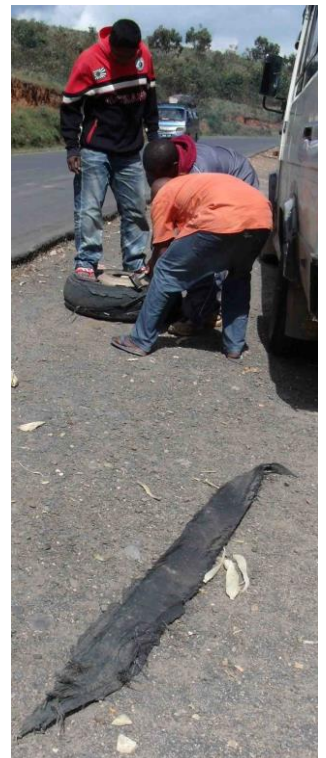
Voici ce qu'il reste du pneu et de sa bande de roulement. Mais où sont les normes de sécurité européennes ?