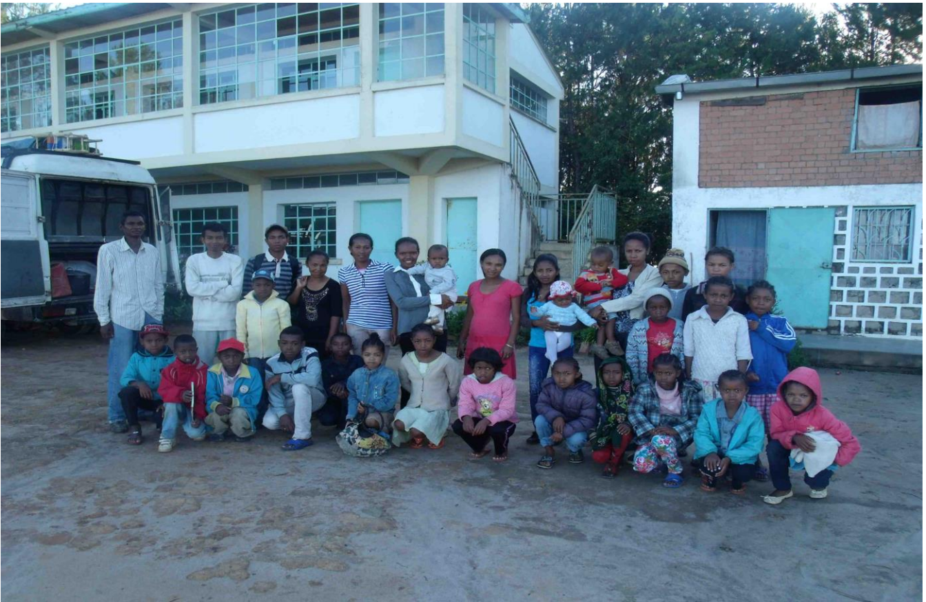
Le CP2 (année scolaire 2015/2016) et les enseignants de l'école primaire Fanantenana de Tananomby