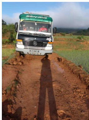
Franchissement problématique de la route digue