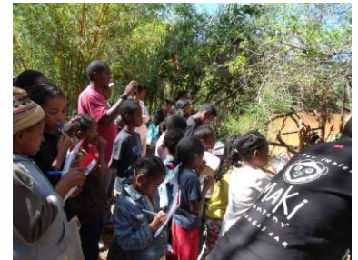
Elèves et enseignants notent soigneusement les commentaires du guide.

Après cela, on pouvait espérer une journée de calme mais... ceci est une autre histoire.