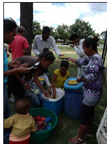
Distribution du repas de midi