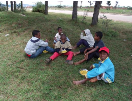
Les garçons pendant le pique-nique à Antsirabe. Même dans notre école pourtant mixte le clivage filles/garçons se fait spontanément. Dure dure la tradition !