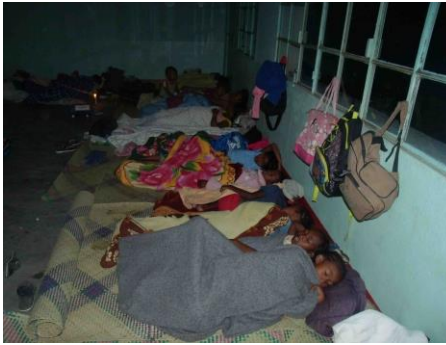
C'est parti pour une nuit d'enfer

Autre arrêt une cinquantaine de kilomètres plus loin pour changer un pneu ayant perdu sa bande de roulement (ça fait un sacré bruit).