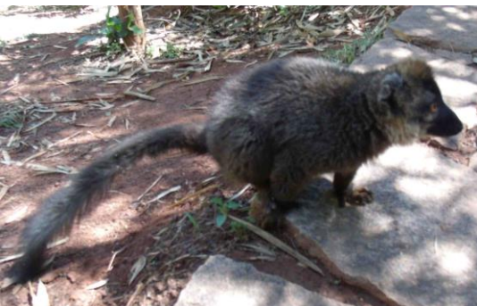
Attention ! Lémurien caractériel mordeur. Espèce rare.