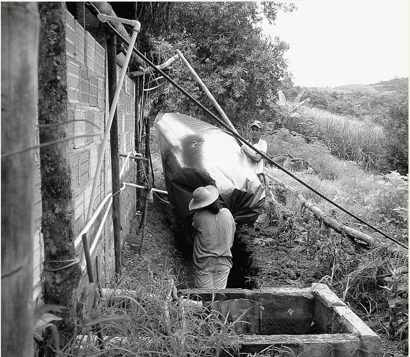
Le biodigesteur placé dans la tranchée.

Le temps d'attente avant la production du gaz dépend de la composition et de la quantité de fumier introduit dans le biodigesteur. Dans